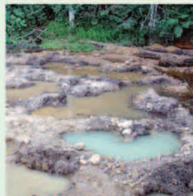
Mkondo wa mto uliopo kwenye msitu umeharibiwa kwa sababu ya uchimbaji ya dhahabu

Nishati ya Umeme inayotumia maji kutoka Misitu ya Tao la