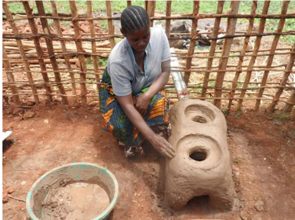
Mama akitengeneza jiko banifu

mafunzo ni TUMIM (Kata ya Mhonda), JUWAMIPE (Kata ya Pemba), HIMIDI (Kata ya Diongoya) na HIMAYAKA (Kata ya Kanga). Katika zoezi hili jumla ya wanamtandao 53 walijifunza na kutengeneza majiko.