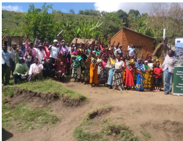
wanakijiji wakifurahia uzinduzi wa mradi wa AVA

Wananchi wa kijiji cha Maskati wa kizindua mradi wa AVA